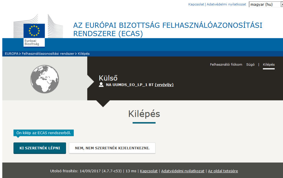
12. ábra: Kilépési lehetőségek

Megjegyzés: A teljes kilépés érdekében erősen ajánlott mindig bezárni a böngészőt. Ez a legbiztonságosabb módja annak, hogy senki más ne tudja az alkalmazást újraazonosítás nélkül elérni, és hogy a „Honnan jelentkezik be?” (WAYF) képernyőn megadott új adatok helyesen figyelembevételre kerüljenek egy újabb azonosítási folyamat során.