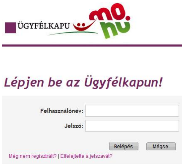
7. ábra: Ügyfélkapu bejelentkezés

Miután a felhasználó kitöltötte a „Honnan jelentkezik be” (WAYF) oldalt, átirányításra kerül a kiválasztott tagállami azonosítási rendszerbe. Magyarországon ez az Ügyfélkapu.